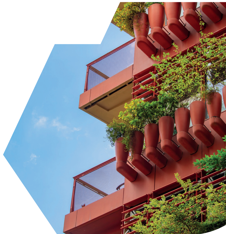
Photos non contractuelles ne constituant pas un engagement quant aux futures acquisitions.

L'objectif de performance n'est pas garanti; le taux de distribution et la valeur de part peuvent évoluer dans le temps.